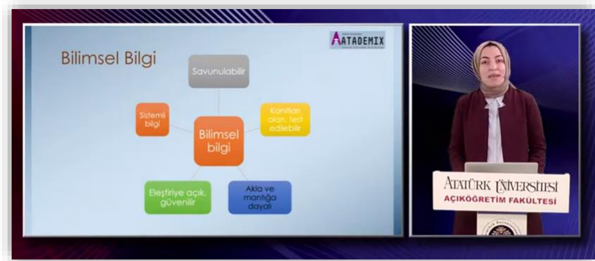
Resim 4. Makale Yazma Dersine İlişkin Stüdyo Ortamında Hazırlanan Bir Video Materyal Görüntüsü (Resme tıklayarak videoya ulaşabilirsiniz.)