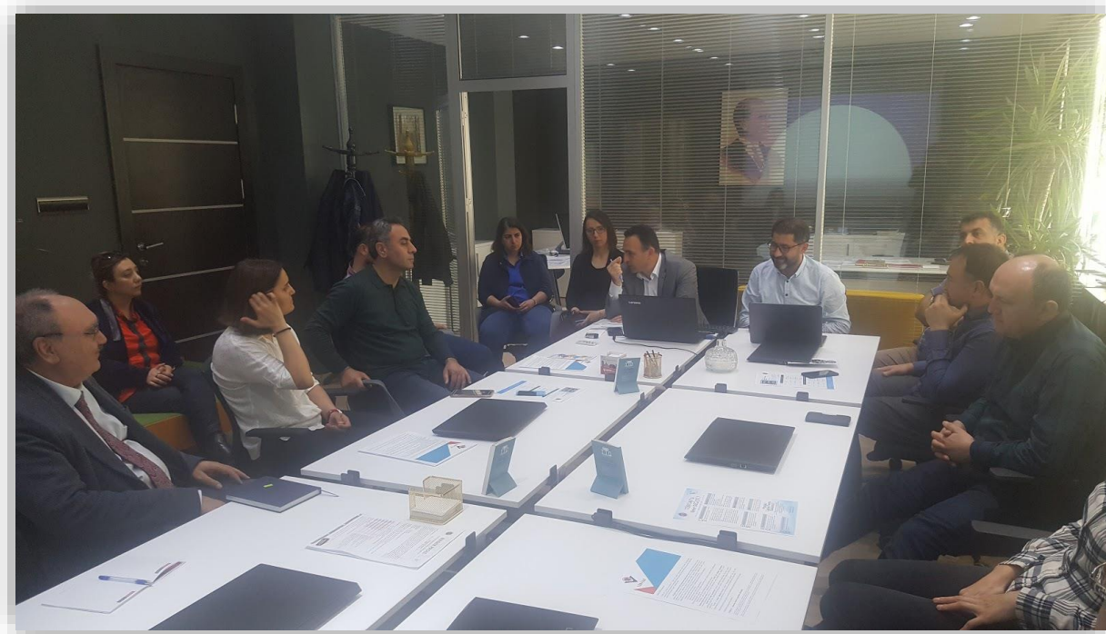
Resim 2. Proje Yazma Dersinin Tasarımı İçin Paydaşların Bir Araya Getirilmesi

AtademiX'te verilecek derslerin yapısı ve tasarımına ilişkin faaliyetler Açıköğretim Fakültesi ile işbirliği içerisinde yürütülmüştür. Bu süreçte ofis faaliyetleri kapsamında paydaşların bir araya getirilmesi sağlanmıştır.